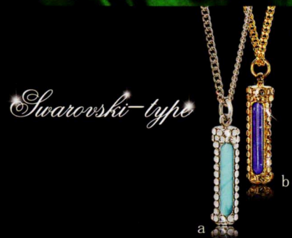
ゴールドシルバー レッド ブルー ペンシルタイプ フットボールタイプ