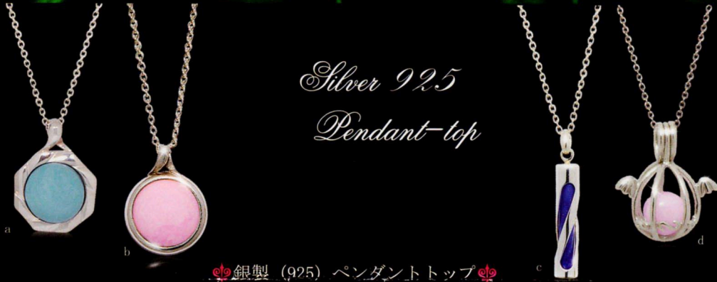
銀製 (925) ペンダントトップ